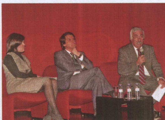
Os responsáveis do IPCB e do NERCAB na apresentação do curso

Ambas as tipologias integram uma componente de formação teórico-prática, com uma duração de 75 horas, em que se desenvolvem conteúdos relacionados com diversos domínios da gestão de micro e pequenas e médias empresas, e uma componente de aconselhamento de natureza individual, num total de 50 horas, assegurada por um consultor, em que se pretende apoiar o empresário a desenvolver as suas competências e identificar as suas necessidades de formação e que deverá culminar com a definição de um plano estratégico de desenvol-