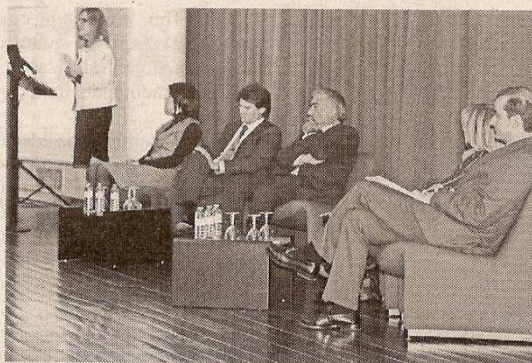
A apresentação foi efectuada no Nercab

O Politécnico de Castelo Branco é a primeira instituição do país a iniciar uma formação específica para empresários. A Escola Superior de Gestão é responsável pelo curso.