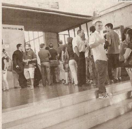
Segunda fase trouxe mais 301 novos alunos, totalizando 1.472 colocados este ano

OS ALUNOS que tenham de concorrer à terceira fase de acesso ao ensino superior ainda podem escolher uma das 660 vagas que região mantém em aberto. As opções espalham-se pelos vários cursos que não foram totalmente preenchidas nas três instituições de ensino da região, sendo que a Universidade da Beira Interior (UBI) é aquela que, tendo obtido melhores resultados nas duas primeiras fases, tem agora menos oferta. No total, das 1295 vagas apresentadas no início do processo, sobram na UBI apenas 49 vagas. Mil cento e setenta e uma já tinham sido preenchidas na primeira fase, e 78 foram preenchidas agora. Por preencher ficaram apenas os cursos de Filosofia em regime pós-laboral (9 vagas), Biotecnologia (1), Engenharia Electrotécnica e de Computadores (7), Engenharia Informática (3), Química Industrial (20) e Bioengenharia (8). No que concerne ao Instituto Po-