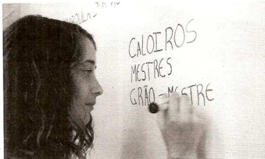
Politécnico de Castelo Branco e UBI, em conjunto, ainda têm 348 vagas por ocupar

Das 1002 vagas iniciais do Instituto Politécnico de Castelo Branco (IPCB) para o Concurso Nacional de Acesso ao Ensino Superior, um terço continua por ocupar, mesmo após a segunda fase de concurso. Doze cursos ficaram mesmo com menos de 20 alunos, o que põe em causa o financiamento por parte do Estado. Mas fonte do IPCB referiu à Gazeta do Interior que há ainda concurso especiais e outro para maiores de 23 anos, para além de uma terceira fase de acesso, e