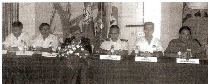
Apresentação do Rali Terras da Raia decorreu nas Termas de Monfortinho

O Rali TT Terras da Raia, que se disputará de 24 a 26 de Setembro, pretende ser o espetáculo de uma parceria de sucesso, e representa para a Escuderia Castelo Branco, o início de uma nova era nesta categoria, pelo interesse que a prova desperta em termos de campeonatos nacionais, mas igualmente porque a internacionalização da prova em termos de Motos e Quads, vai ser uma realidade.