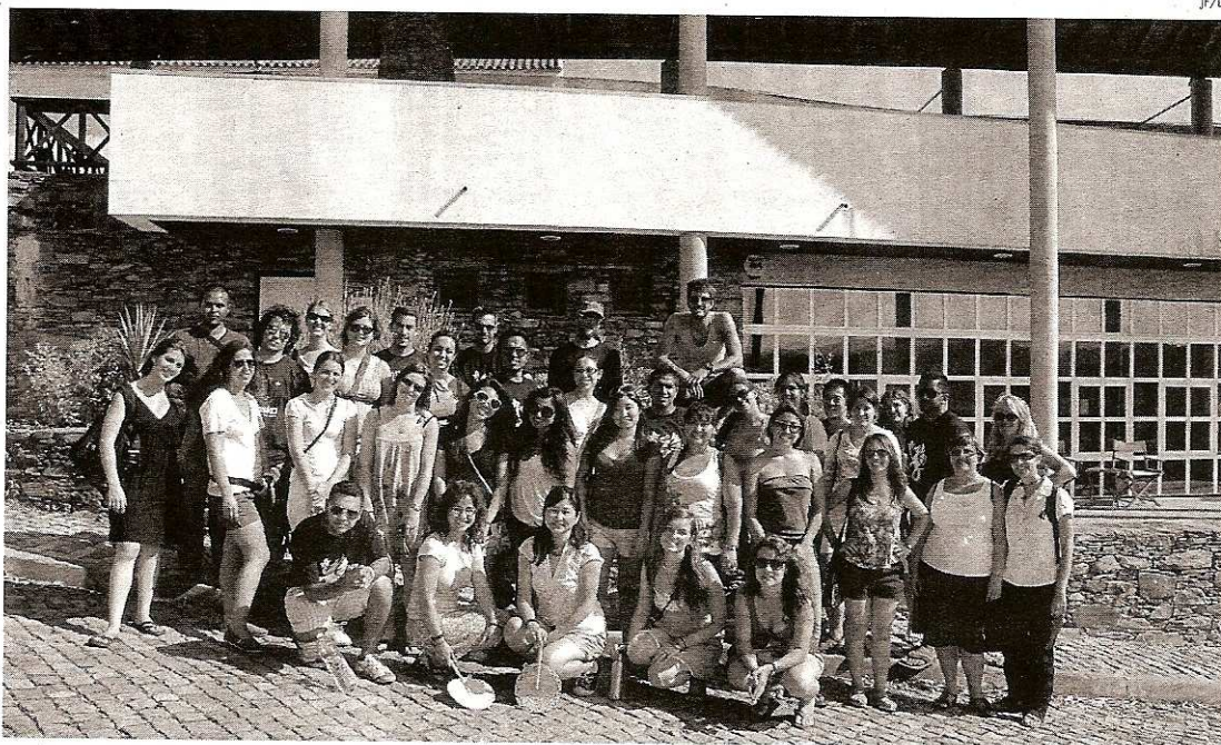
Os alunos americanos visitaram várias aldeias inseridas no Geopark Naturtejo

■ Este programa resulta de uma parceria estabelecida entre a Universidade de Berkeley, Geopark Naturtejo, Politécnico de Castelo Branco e a U. do Minho